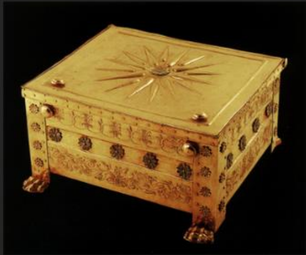
Η χρυσή λάρνακα με τα οστά του Φίλιππου Β'

Φωτομνημείο του Φιλίππου Β' βάση των λειψάνων του.