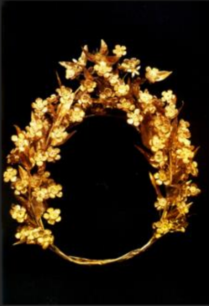
Χρυσό διάδημα από τον τάφο